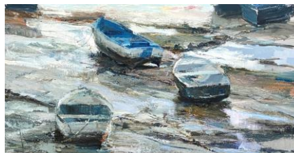
Bajamar , 2020. Óleo sobre tabla. 100 x 190 cm