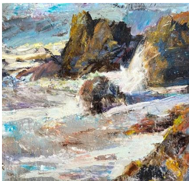
Olas rompiendo , 2017. Óleo sobre lienzo. 170 x 180 cm