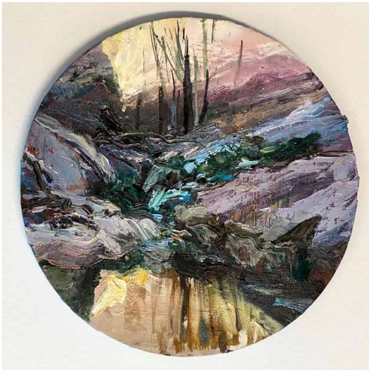
Río II , 2020 > Óleo sobre lienzo > 30 cm diámetro