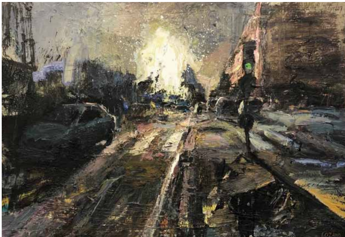
Retrato de ciudad , 2020 > Óleo sobre lienzo > 89 x 130 cm