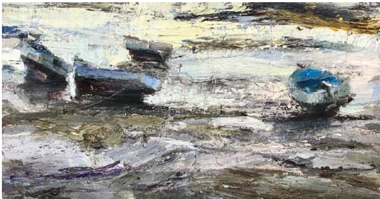
Barcas , 2020 > Óleo sobre tabla > 100 x 190 cm