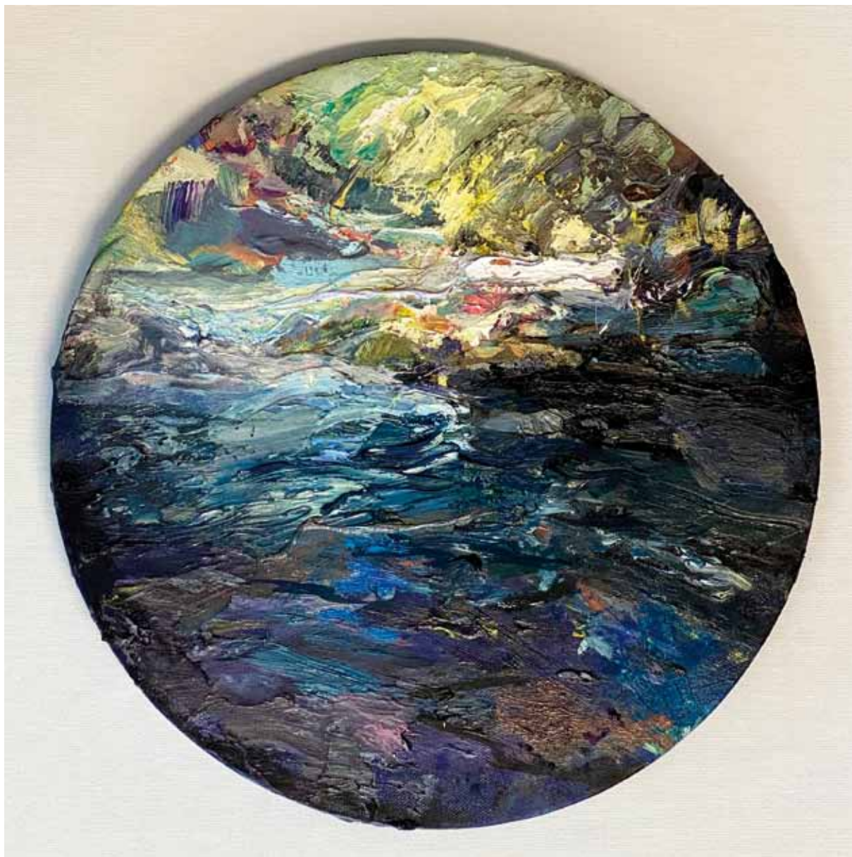
Río , 2020 > Óleo sobre lienzo > 30 cm diámetro