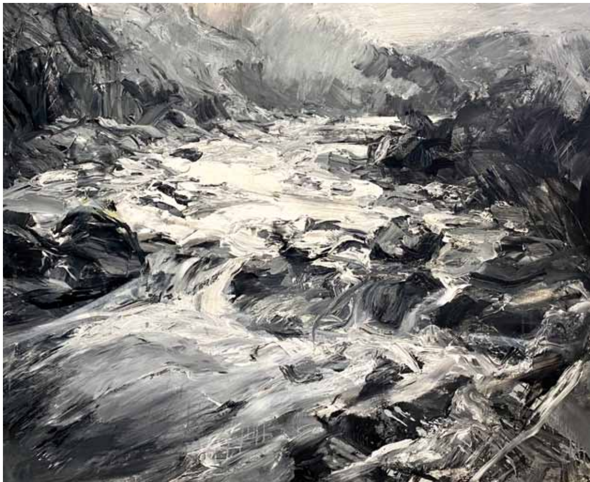
Paisaje en blanco y negro. Valle de Estós, 2019 > Óleo sobre lienzo > 130 x 160 cm