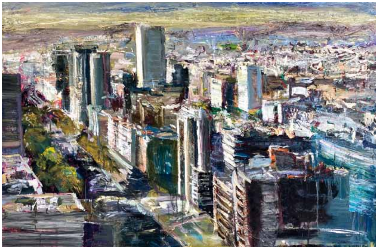
Vista de Madrid , 2015 > Óleo sobre lienzo > 130 x 195 cm