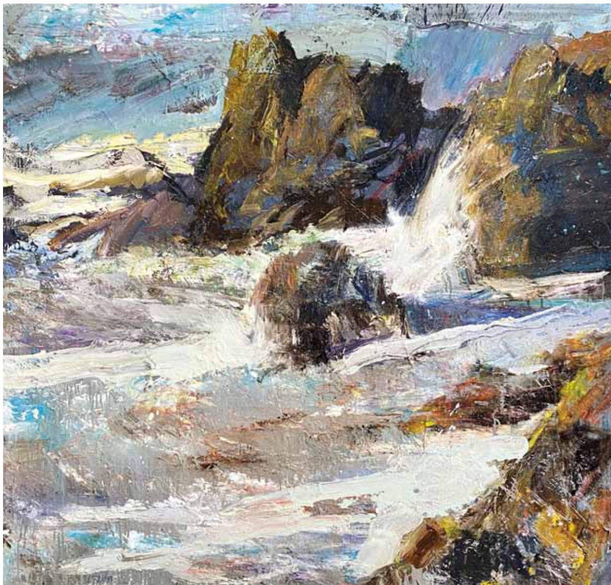
Olas rompiendo , 2017 > Óleo sobre lienzo > 170 x 180 cm