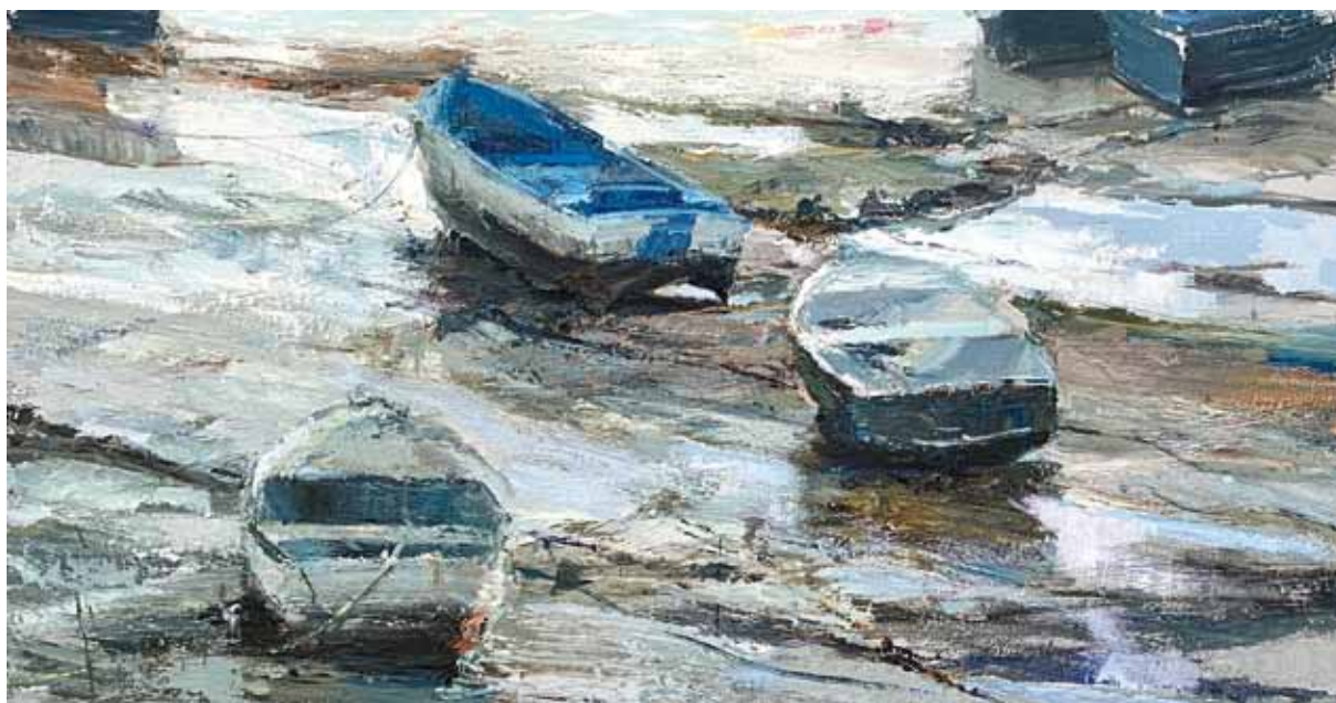
Bajamar , 2020 > Óleo sobre tabla > 100 x 190 cm