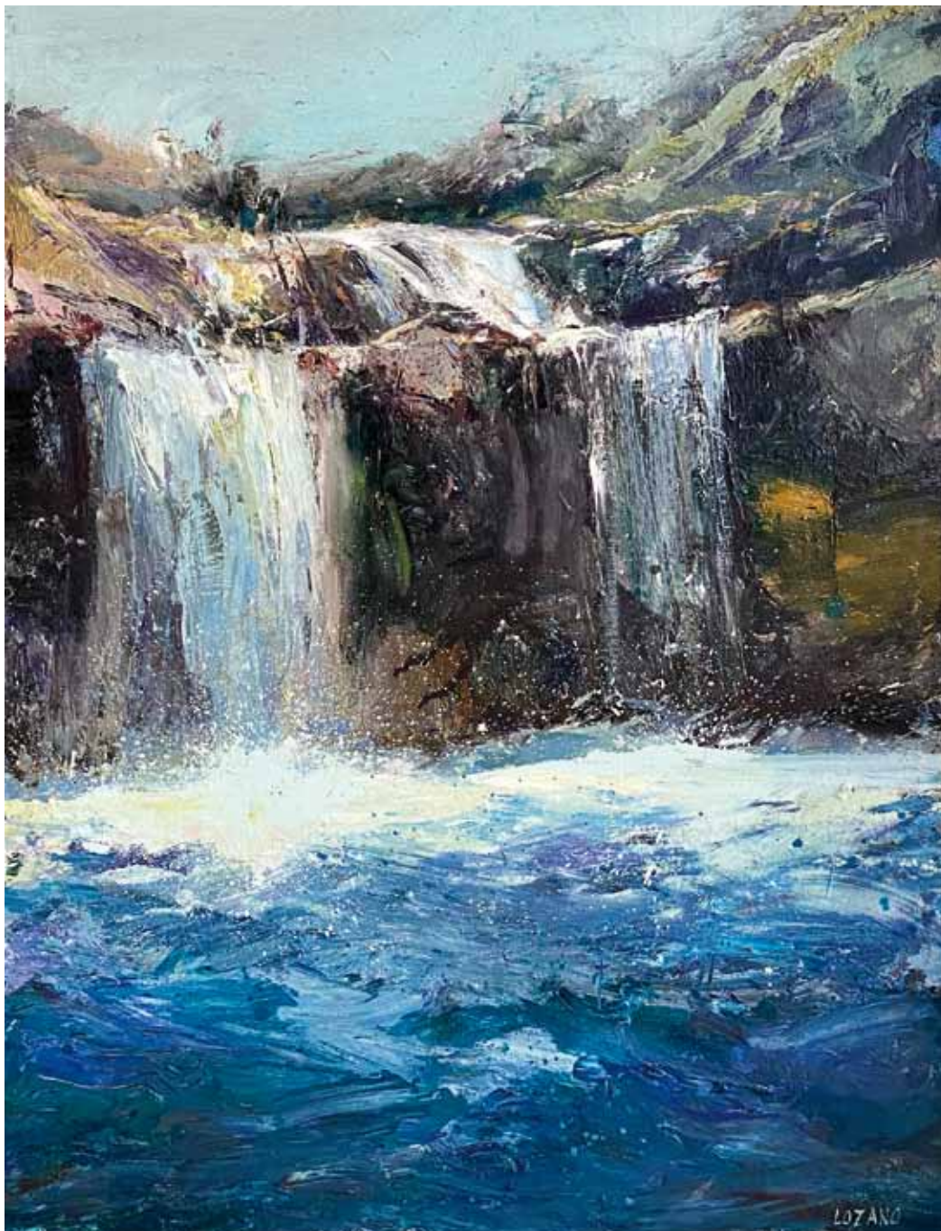
Cascada , 2017 > Óleo sobre lienzo > 116 x 89 cm